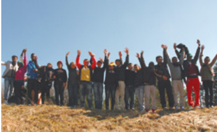
GLEICHE RECHTE FÜR ALLE