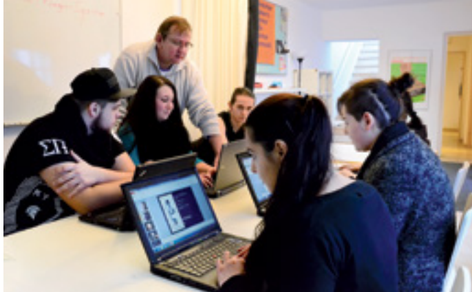
JUGEND - ARBEIT - PERSPEKTIVEN IV