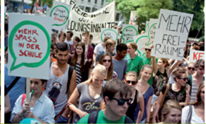
DARF ICH MITREDEN?!