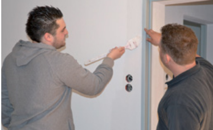
JUGEND - ARBEIT - PERSPEKTIVEN III