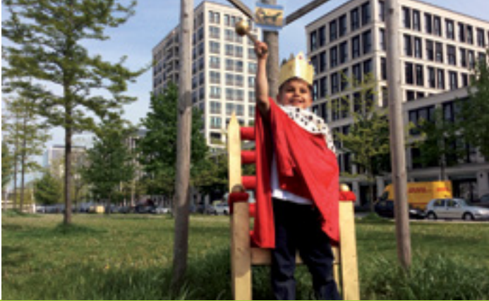
KINDERRECHTE, KOOPERATIONEN UND PROJEKTE