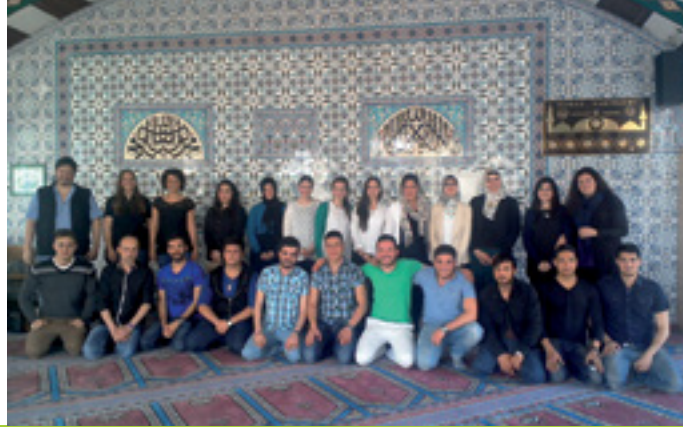
ALLE SIND WILLKOMMEN