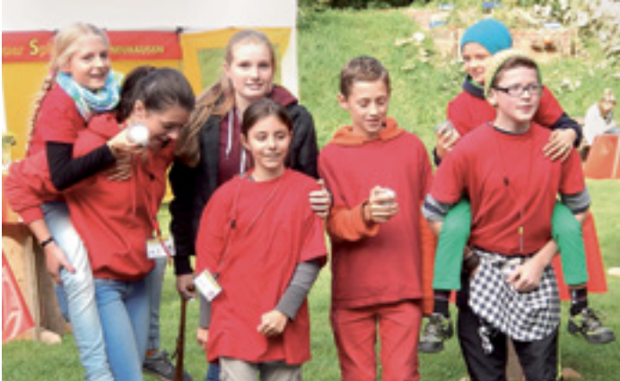
GRÜNE OASE MITTEN IN DER STADT