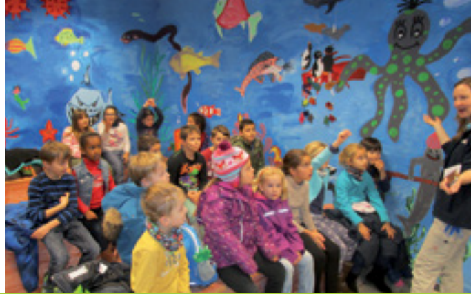
PLATZ ZUM SKATEN UND RAUM FÜR KREATIVITÄT