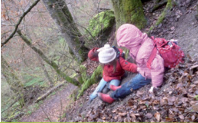
LERNEN, ERLEBEN, SELBER MACHEN