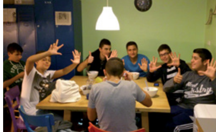
STÄRKEN UND SCHWÄCHEN IM BLICK