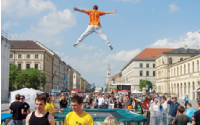
BEWEGUNGSFREIHEIT IM ÖFFENTLICHEN RAUM