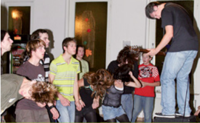
MIT JESUS LEBEN