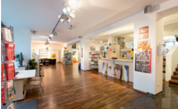
INFORMATION UND BERATUNG