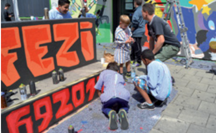
VIELE ANGEBOTE UNTER EINEM DACH