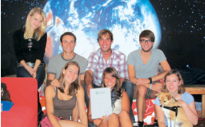
WE HAVE A DREAM