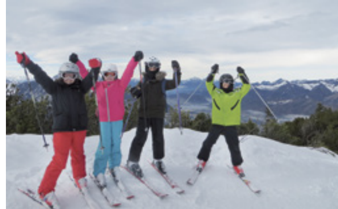
BEWEGUNG & BILDUNG