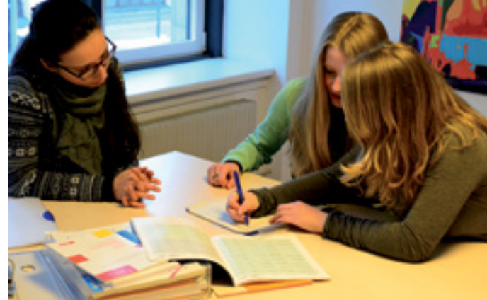
JUGEND - ARBEIT - PERSPEKTIVEN V