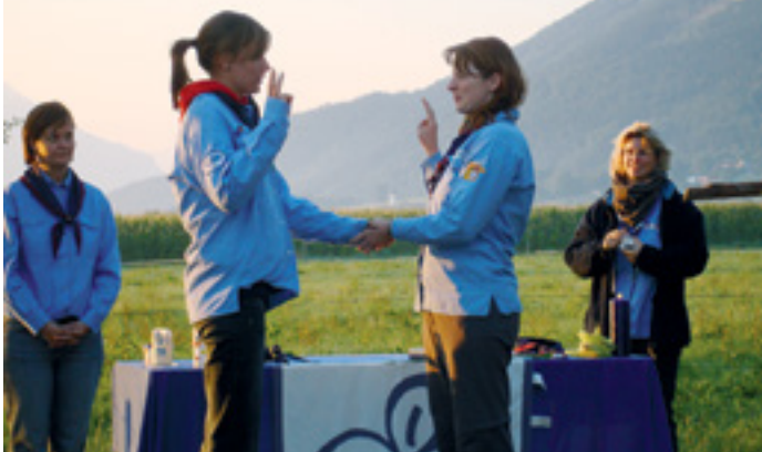
MIT OFFENEN AUGEN DURCH DIE WELT