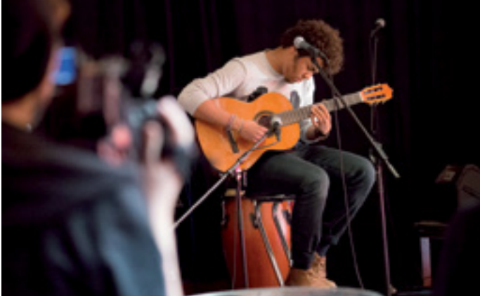
MUSIC & MORE