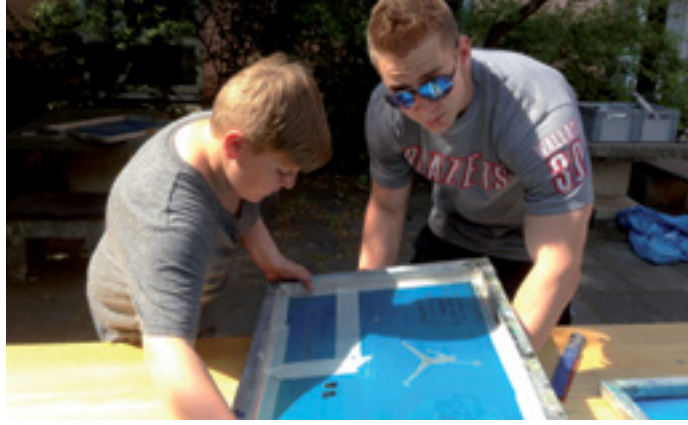
FREIZEIT AKTIV GESTALTEN