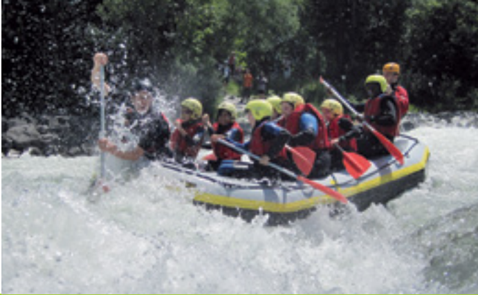
WIR HOLEN EUCH RAUS!