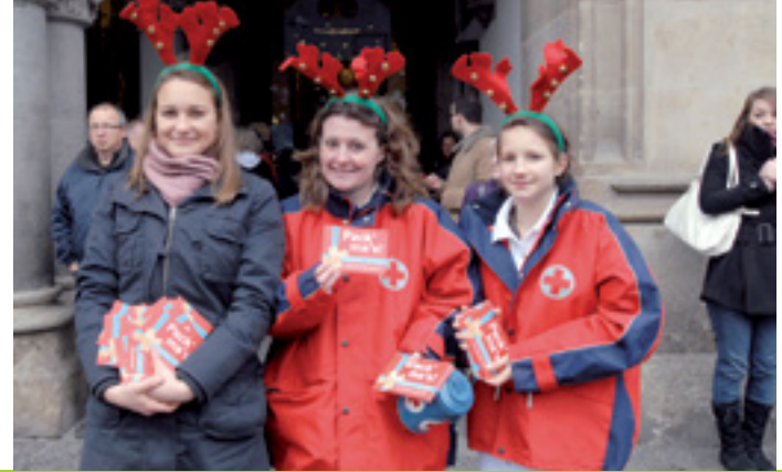
MENSCHLICHKEIT HAT VIELE GESICHTER