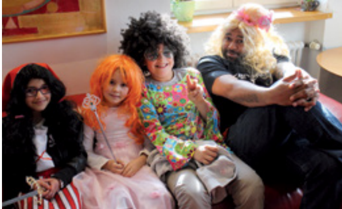
ATTRAKTIVE UND VIelfÄLTIGE ANGEbOTE