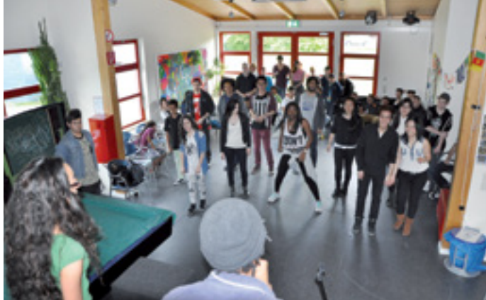
COME IN – WE'RE OPEN!