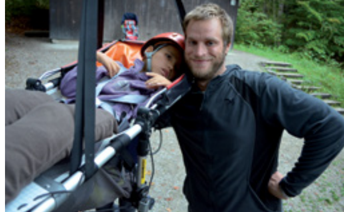
ERLEBEN - BEGEGNEN - SOLIDARISIEREN