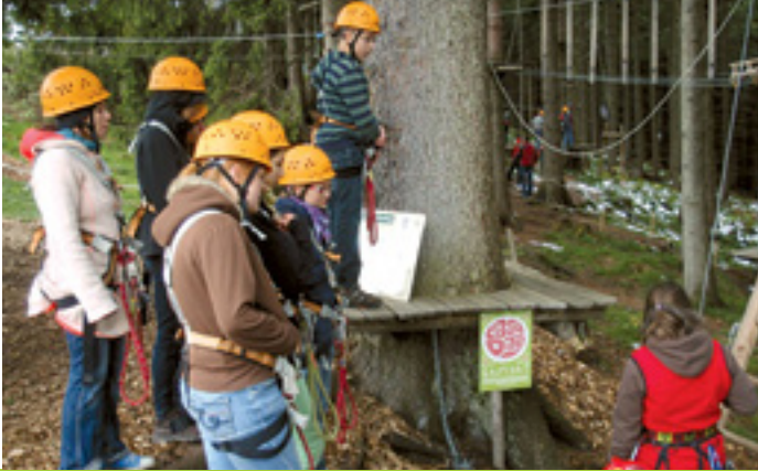
UMWELT ERLEBEN - WAS BEWEGEN