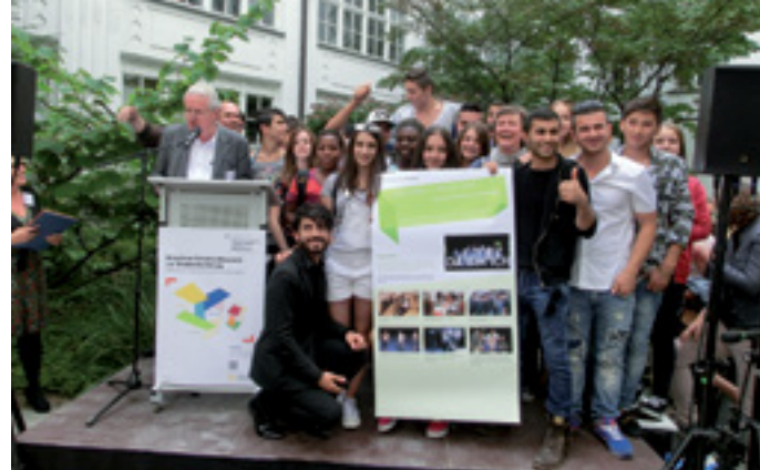
TREFFPUNKT FÜR KINDER UND JUGENDLICHE