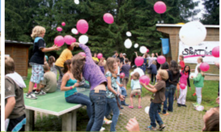
SOZIALE GEGENSÄTZE ÜBERWINDEN