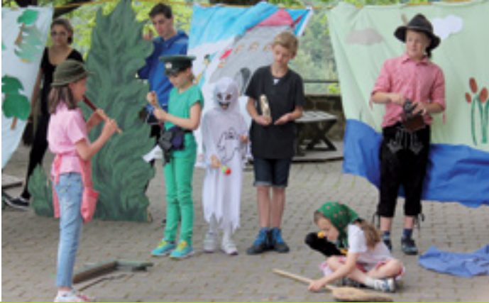
ZUSAMMENLEBEN IN KULTURELLER VIELFALT