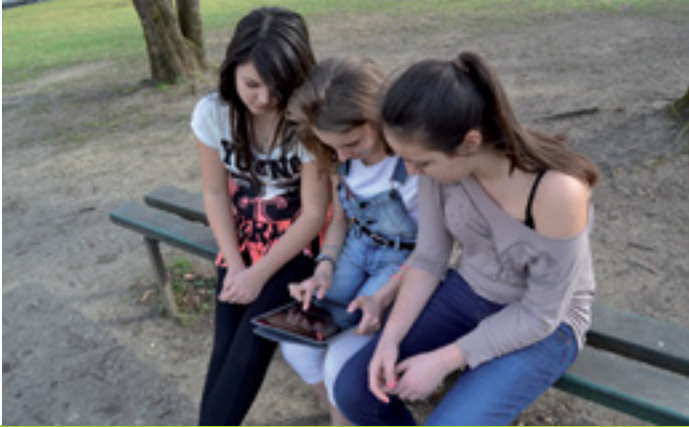
SICHER UND KREATIV IM WEB #LÄUFTBEIUNS