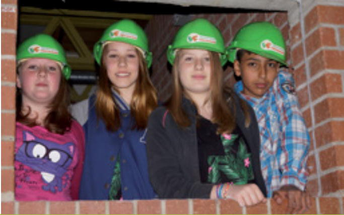
VIELFÄLTIGE ANGEBOTE FÜR ALLE