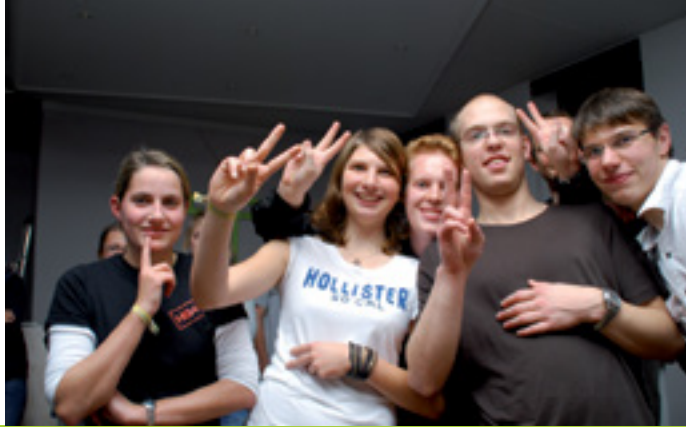
TREFFPUNKT FÜR JUNGE LEUTE