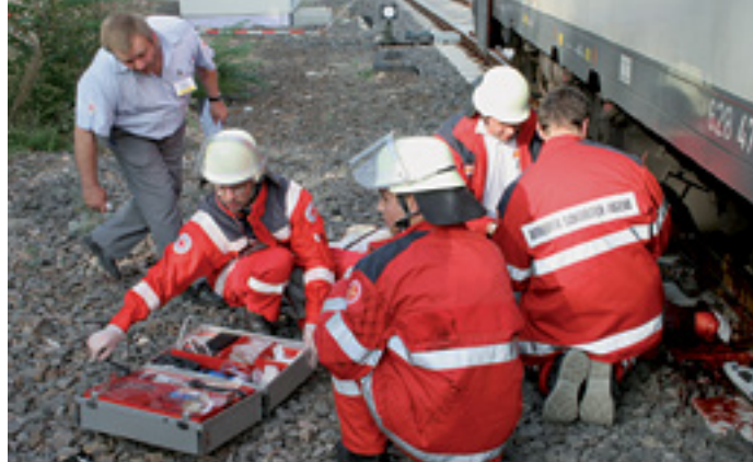
FÜREINANDER DA SEIN