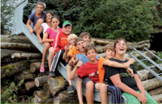
GELD BESTIMMT NICHT UNSEREN WERT