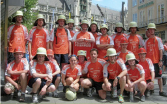
VERANTWORTUNG UND TEAMGEIST