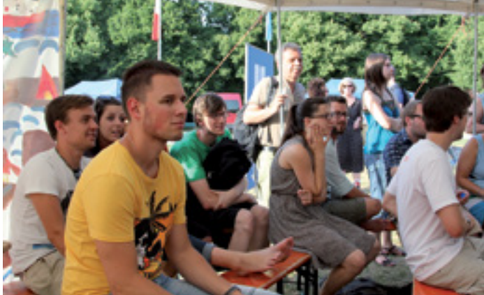
WIDER DAS VERGESSEN