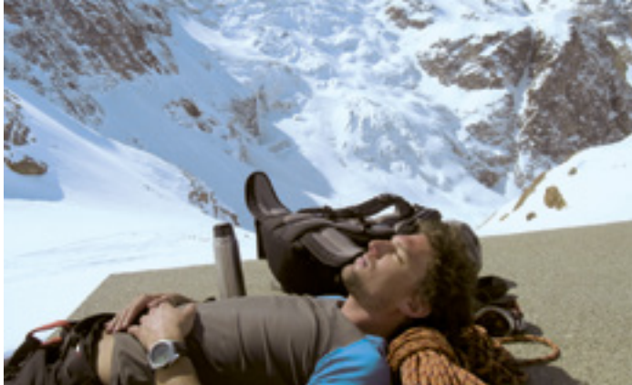
ALPINISTIK UND SOZIALES ENGAGEMENT