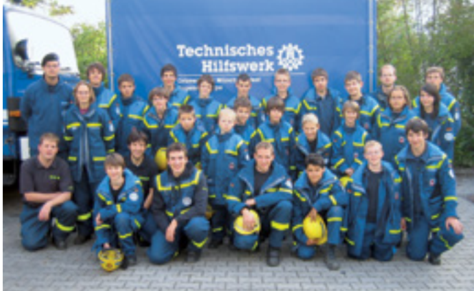
SPIELEND HELFEN LERNEN