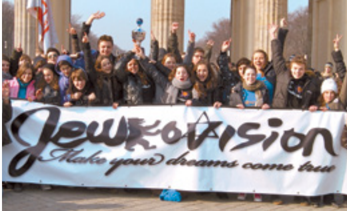
JÜDISCHE GESCHICHTE UND KULTUR