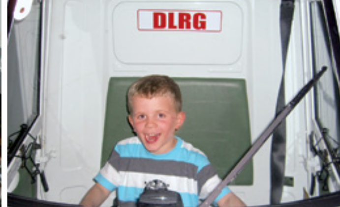
„SCHWIMMEN LERNEN - LEBEN RETTEN“