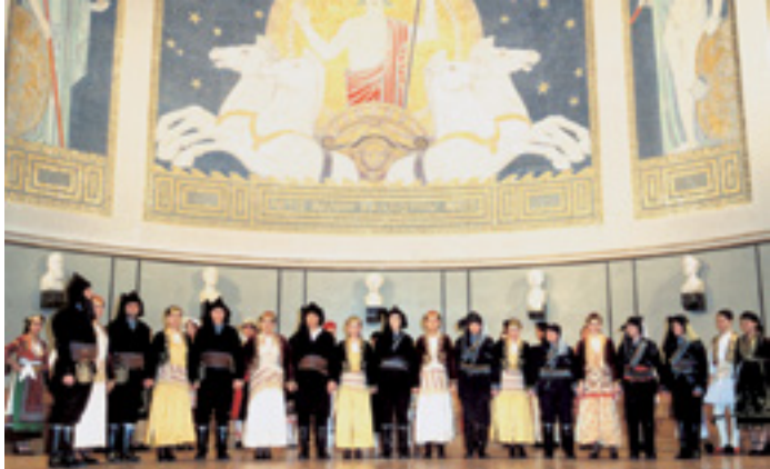
PFLEGE DES KULTURERBES