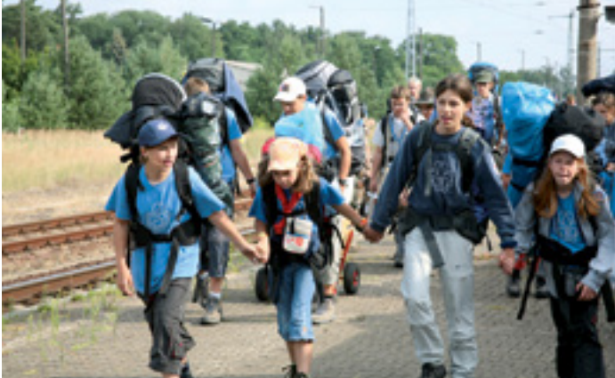
MITVERANTWORTUNG DES EINZELNEN