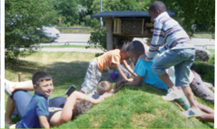
UNKRAUT VERGEHT NICHT