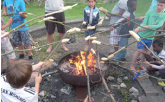
SPIEL, SPORT, KREATIVITÄT UND FERIEN