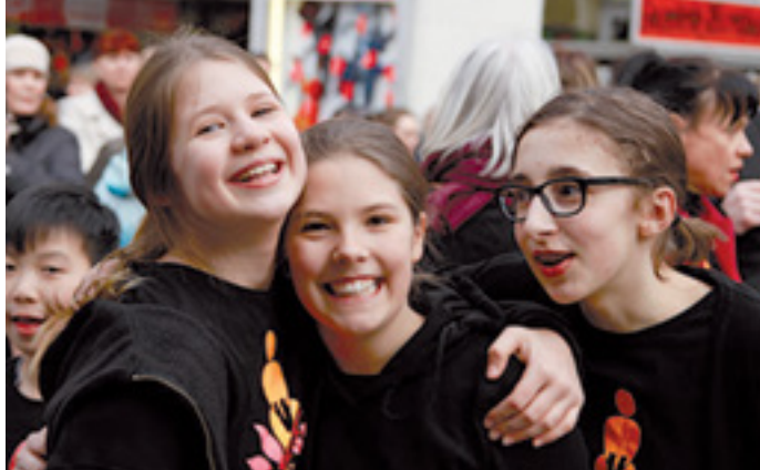
ENTDECKEN – SPIELEN – LERNEN