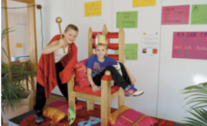
BETEILIGUNG UND KREATIVITÄT