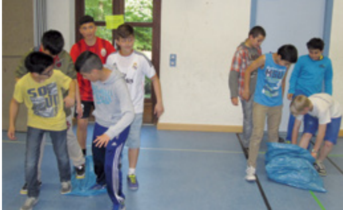
DER GRÜNSTE TREFF IN NEUPERLACH