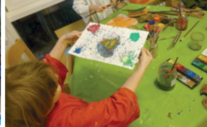
GANZHEITLICHES UND SPIELERISCHES LERNEN