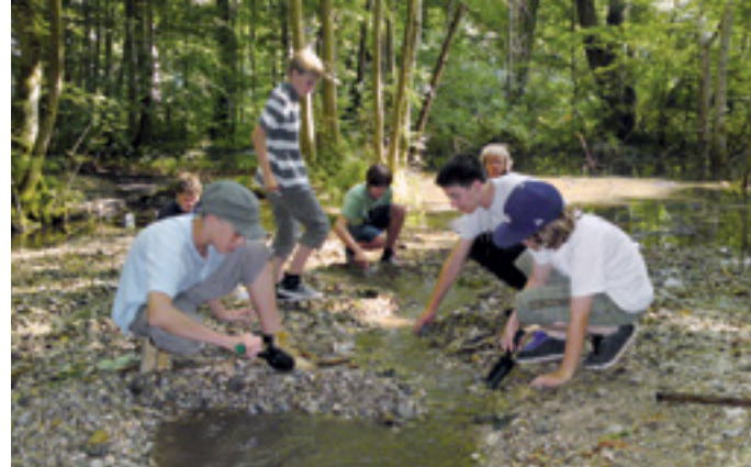
GEWÄSSERREINHALTUNG UND ARTENSCHUTZ