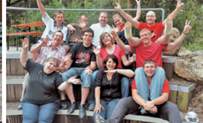
EINE IDEE LEBT