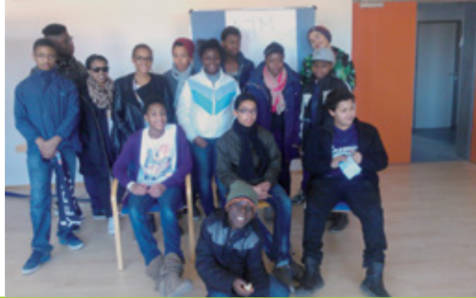
DIE AFROJUGEND MÜNCHEN STARTET DURCH