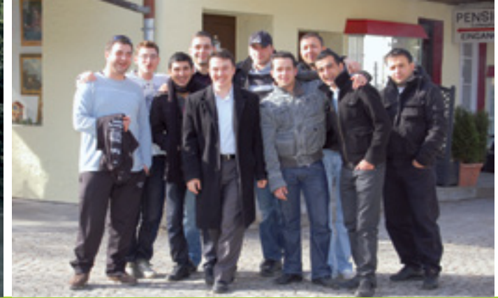
INTEGRATION UND BILDUNG