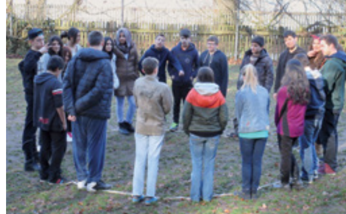
JUGEND - ARBEIT - PERSPEKTIVEN II