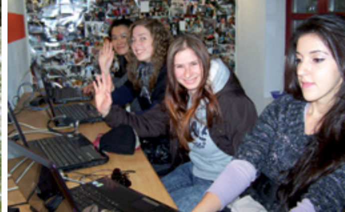
KULTURAUSTAUSSCH BEIM LÄNDERABEND