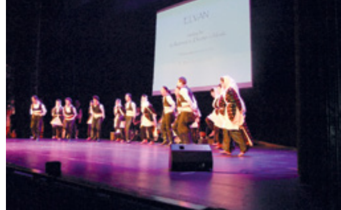
VOLKSTÄNZE AUS ANATOLIEN UND TRAZIEN