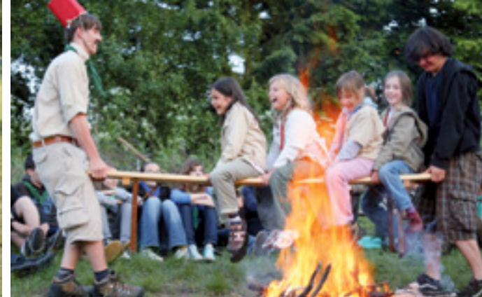
DER WEG IST DAS ZIEL