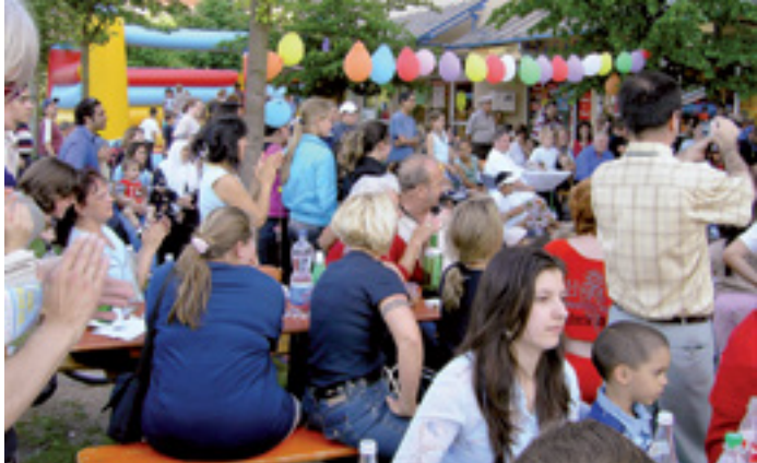
UNTERSTÜTZUNG FÜR KINDER MIT MIGRATIONSHINTERGRUND