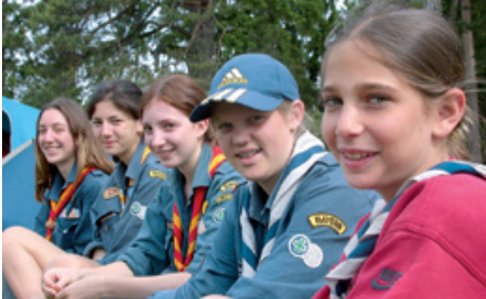
JUGENDBEGEGNUNG UND -SEELSORGE