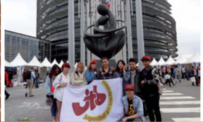
60 JAHRE TRADITION UND INNOVATION