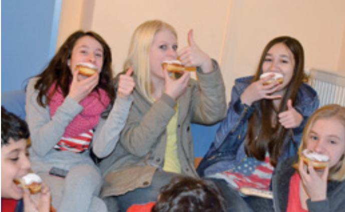
KLEIN, ABER KLIMA!