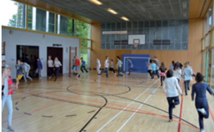
RAUM & BEWEGUNG