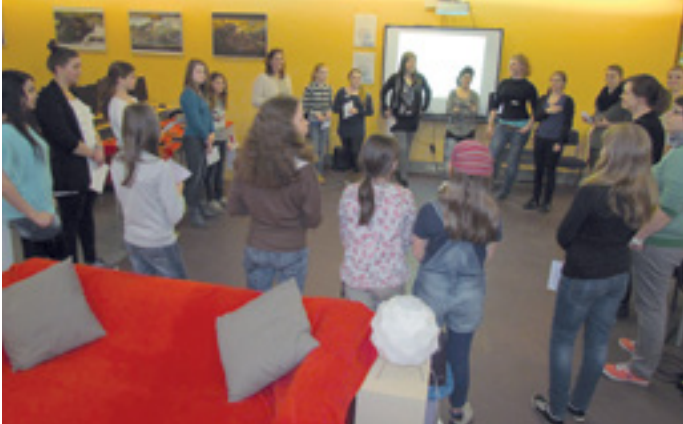
WO BIST DU ZU HAUSE: WEB 2.0, FACEBOOK, GAMING?