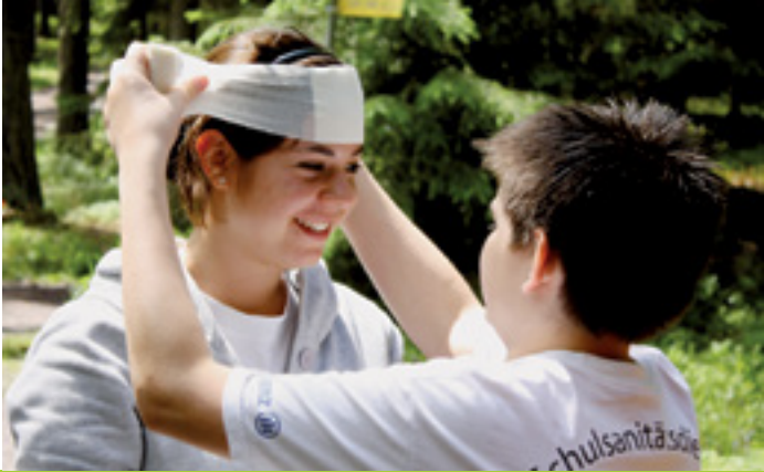
ERSTE HILFE „KINDERLEICHT“