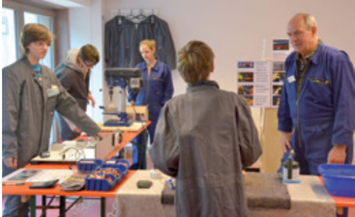
JUGEND - ARBEIT - PERSPEKTIVEN