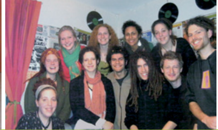
SOZIALES ENGAGEMENT UND ENTWICKLUNGSARBEIT