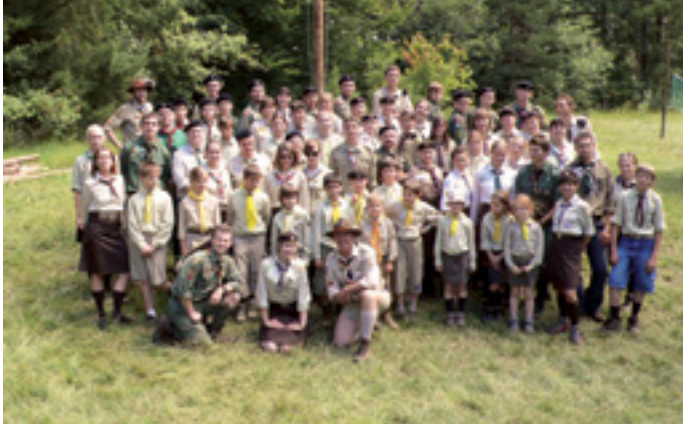
GEMEINSCHAFTSSINN UND ENGAGEMENT