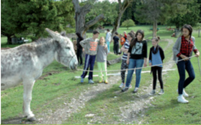
OFFENER TREFF UND MITTAGSBETREUUNG