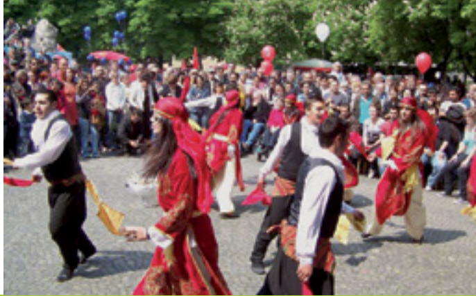
GEMEINSAM GEGEN RASSISMUS