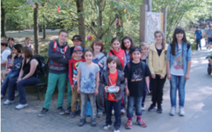
WOHLFÜHLEN UND SPIELEN