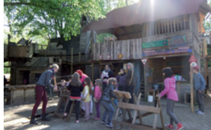
EINE STADT VON KINDERN FÜR KINDER