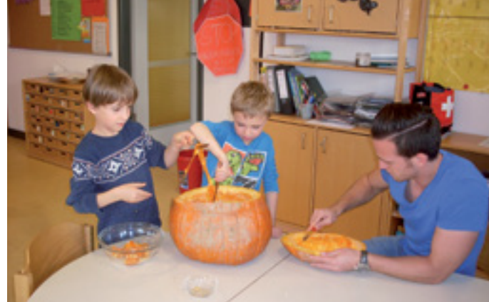
SPRACH- UND BEWEGUNGSFÖRDERUNG