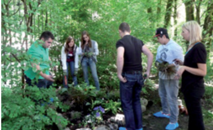
FREIZEITGESTALTUNG MEETS JUGENDBILDUNG