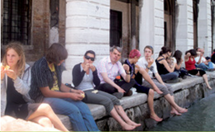
MAN SELBST SEIN DÜRFEN