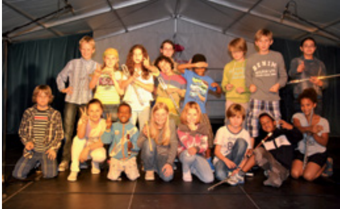
DAS HAUS DER KINDERKULTUR