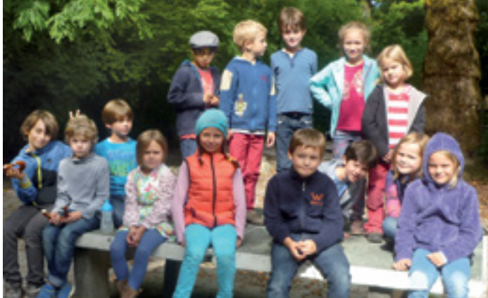
KINDERFREUNDLICH UND UMWELTBEWUSST