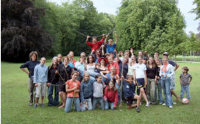
GLAUBE UND FREIZEIT