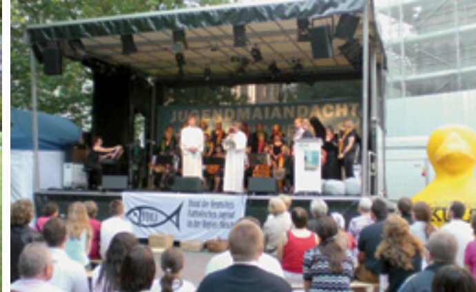
KATHOLISCH – POLITISCH AKTIV