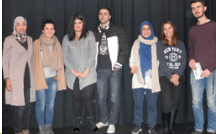
INTERKULTURELLE BEGEGNUNG UND BILDUNG