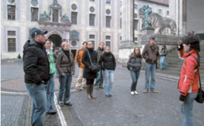
AKTIV UND SELBSTBEWUSST LEBEN