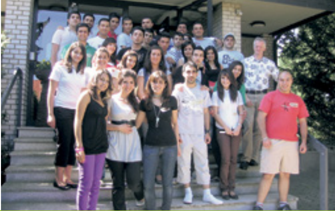
VÖLKERVERSTÄNDIGUNG UND INTEGRATION