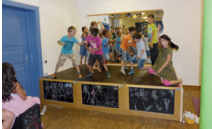
NUR FÜR KINDER – IN UNTERGIESING!