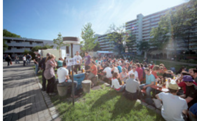
FÖRDERUNG VON KULTURELLEM LEBEN