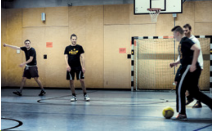
SPORT BIS MITTERNACHT