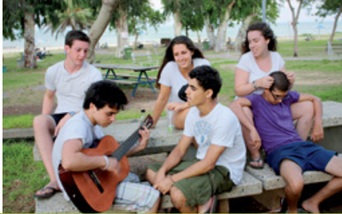
LIEBE ZU ISRAEL