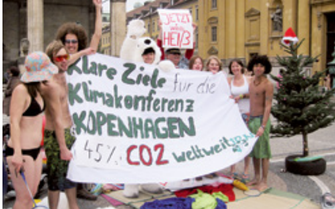
UMWELT BEGREIFEN UND SCHÜTZEN