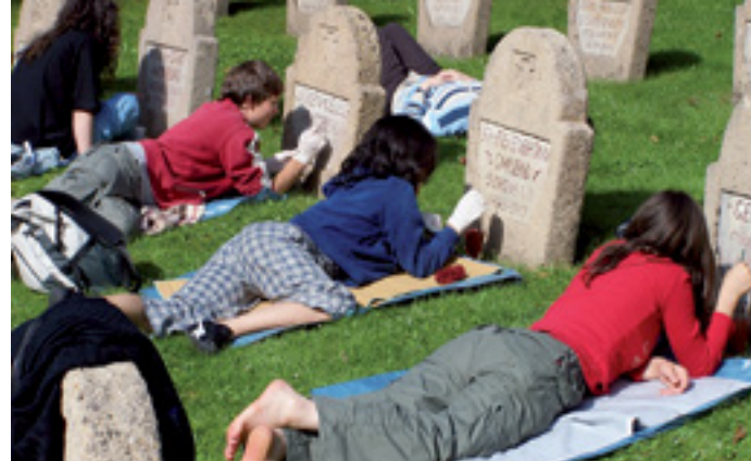
GEGEN KRIEG UND GEWALT