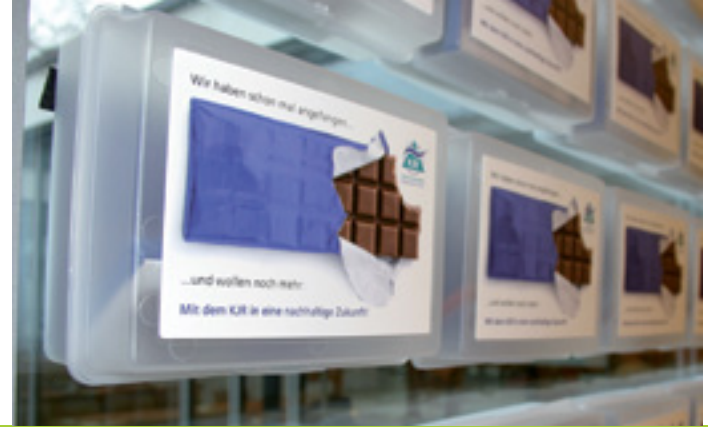
WIR HABEN SCHON MAL ANGEFANGEN