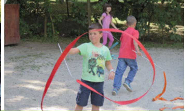
SPIEL UND SPASS AUCH IM CONTAINER