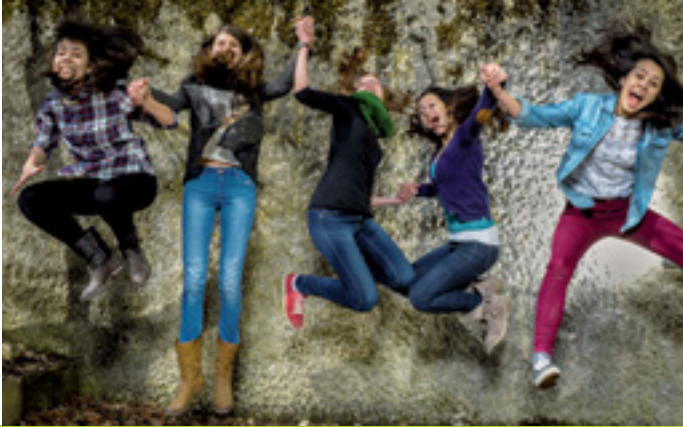
FREUDE AM MÄDCHENSEIN